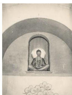
Claude Cahun (1894 - 1954) Autorretrato (sentada, cruzada de piernas como Buda) 1927 Gelatina de bromuro de plata (copia de época) 12 x 9 cm Colecciones Jersey Heritage

© The estate of Claude Cahun. Derechos reservados