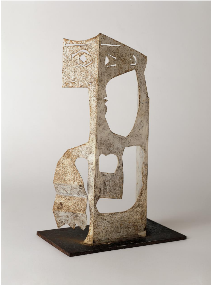
Pablo Picasso (1881-1973). Mujer / Femme. Cannes, 1961.