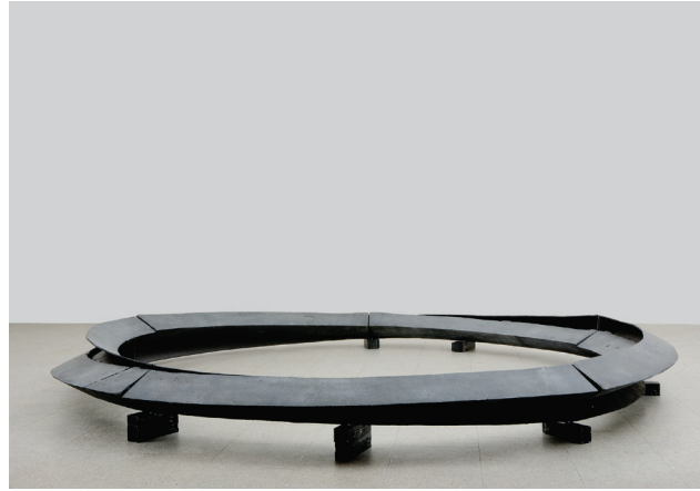
Bruce Nauman Smoke Rings: 2 Concentric Tunnels Skewed, Non Communicating [Anillos de humo: dos túneles concéntricos sesgados, no comunicantes], 1980 Aleación de aluminio con pátina negra, 465 (diámetro) × 53,5 cm Museu Coleção Berardo