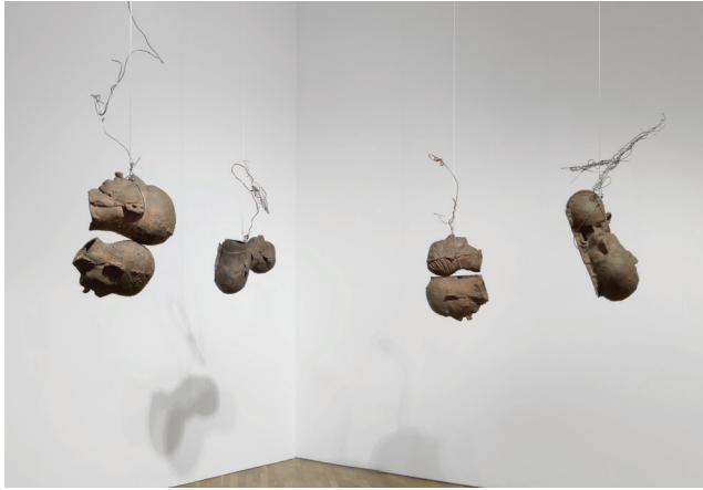
Bruce Nauman Four Pairs of Heads [Cuatro pares de cabezas], 1991 Bronce, alambre de hierro. Dimensiones variables Colección particular