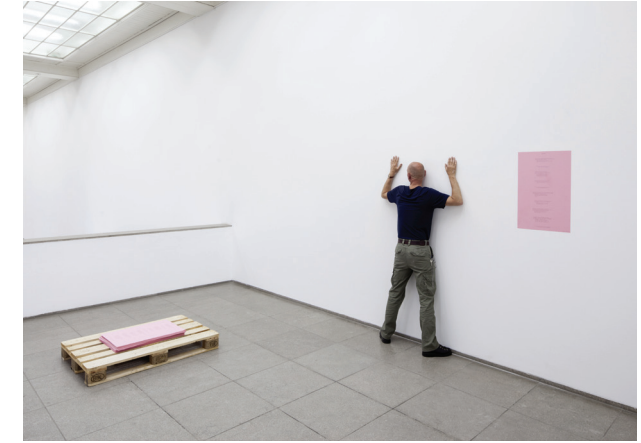
Bruce Nauman Body Pressure [Presión corporal], 1974 Texto sobre pared. Dimensiones variables Friedrich Christian Flick Collection im Hamburger Bahnhof, Berlin

Bruce Nauman (Fort Wayne, Indiana, 1941) ha pasado más de cincuenta años inventando formas para transmitir tanto los riesgos morales como la emoción de estar vivo. Utilizando gran variedad de materiales y métodos de trabajo, revela cómo las experiencias mutables del tiempo, el espacio, el movimiento y el lenguaje suponen una base inestable para comprender nuestro lugar en el mundo. Para Nauman, hacer y mirar arte implica «hacer cosas que no quieres hacer especialmente, ponerte en situaciones desconocidas, someterte a resistencias para descubrir por qué te resistes». Su trabajo obliga al espectador a renunciar a la seguridad de lo familiar, manteniéndole alerta, siempre vigilante y recelando ante la posibilidad de ser seducido por respuestas fáciles.