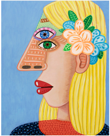
Brian Calvin (1969) Fiore [Flor] , 2023 Acrílico sobre lienzo, 101,6 x 81,3 cm Colección ChanWoo Son.

Para más información sobre la exposición, visitas guiadas, horarios, programa cultural y educativo consulte nuestra web www.museopicassomalaga.org