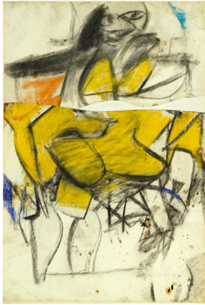
Willem de Kooning (1904-1997)