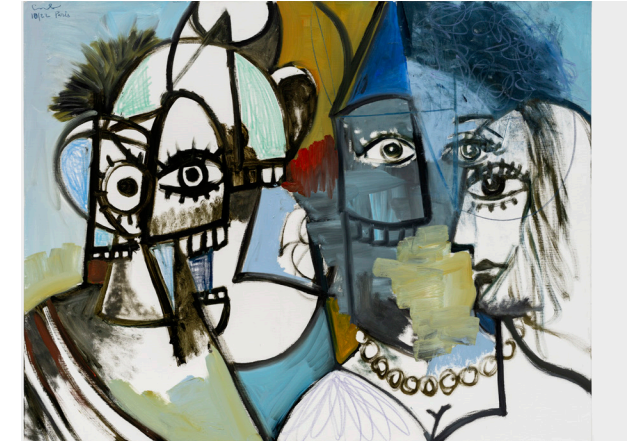
George Condo (1957)

Los artistas contemporáneos, libres una vez más gracias al desahogo que ofrece la supuesta extinción de las vanguardias, establecen con la obra de Picasso relaciones de todo tipo. Michael FitzGerald, historiador del arte y comisario de una de las muestras más importantes sobre la relación