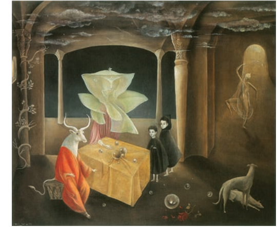
Leonora Carrington (1917-2011) Y entonces vimos a la hija del Minotauro [And Then We Saw the Daughter of the Minotaur], 1953 Óleo sobre lienzo, 60 x 70 cm Colección particular

En la exposición sólo hay artistas mujeres. Pero en ningún caso se trata de una opción "separatista": la creación artística implica a los seres humanos en su conjunto. O incluso con más precisión: una síntesis de la dualidad femenino/masculino. En esta propuesta sólo hay mujeres, pero en una línea de recuperación histórica . No se trata de presentar a estas mujeres en una "escena", o espacio de vida y de trayectoria artística, diferente al de los varones, sino de una llamada de atención sobre la ignorancia o el poco alcance concedido a las mismas,