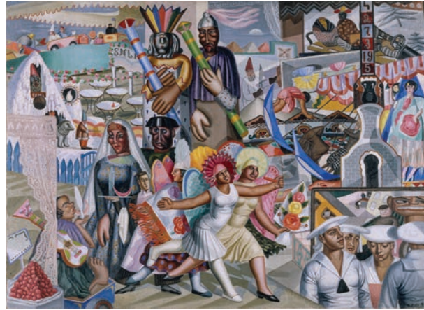
Maruja Mallo (1902-1995) La verbena, 1927 Óleo sobre lienzo, 119 x 165 cm Museo Nacional Centro de Arte Reina Sofía, Madrid

Pero poco a poco, gradualmente, algunas escritoras y un grupo de mujeres artistas fueron apropiándose de espacios de libertad, al margen de los varones, desarrollando propuestas creativas como protagonistas , y ya no meramente como "acompañantes". Una de las más relevantes entre estas mujeres artistas: Leonora Carrington, en una entrevista que concedió en 1993, cuando tenía 75 años, afirmó retrospectivamente: "Pensé que yo tenía mucha afinidad con esa gente. Era un grupo compuesto esencialmente